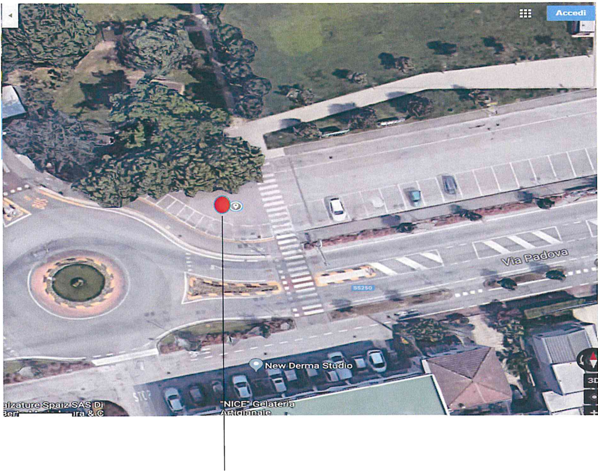
Posteggio n. 3 – Frazione di Tencarola – via Padova area mercatale