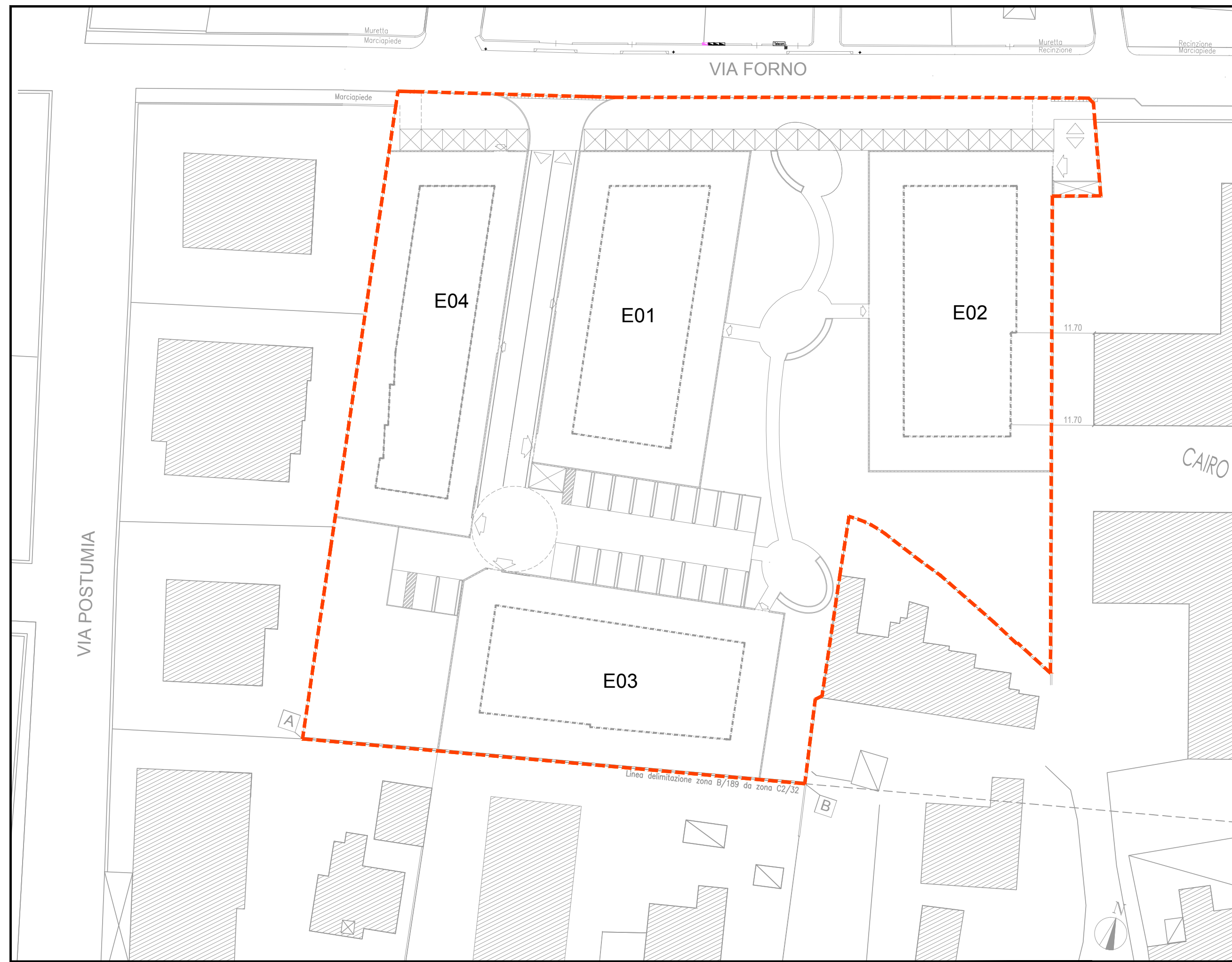
Estratto del planimetrico di progetto: Variante n.1 al PEEP approvato con D.G.C. n. 193 del 07.10.2015 - convenzione attuativa stipulata in data 03.12.2015 - opere di urbanizzazione concessionate con Permesso di Costruire n. 7/2016 del 15.02.2016 (scala 1:500)

STATO CONCESSIONATO: Permesso di Costruire n. 7/2016 del 15.02.2016 relativo alla realizzazione delle opere di urbanizzazione